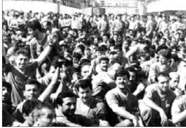
Metal sendikaları ve esnek çalışma

Uzun yıllardır metal sektöründe uygulanan, MESS patronları tarafından her toplu iş sözleşmesinde yeni biçimler ve tarzlarda yeniden gündeme getirilen esnek çalışmanın dayatıldığı iki toplu görüşme süreci geride kaldı. İşçi sendikaları hazırladıkları taslakları sundular. Büyük bir gizlilikle sürdürülen görüşmelerden yansıyanlara bakılırsa, ücret konusunda Birleşik Metal yüzde 18'lik artış isterken Türk Metal yüzde 13 istiyor. Masaya sıfır zamlı oturan MESS ise iş gücü maliyetlerinin yüksekliğinden dem vurarak çalışma yaşamının sınırsızca esnekleştirilmesini dayatıyor.