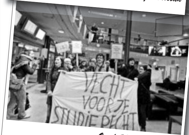
Ocak 2010 | Hollanda