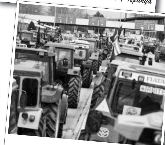
Ocak 2010 | Yunanistan