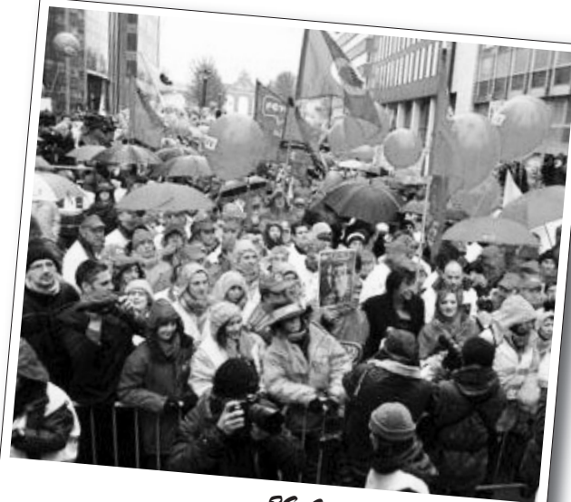
29 Ocak 2010 | Brüksel

Hükümetin öğrencileri öfkelenen planı, hükümetin eğitimde yapacağı kısıtlamalar kapsamında öğrencilere temel burs yerine geri ödeme zorunluluğu olan sosyal borçlanmayı öngörmesini içeriyor.